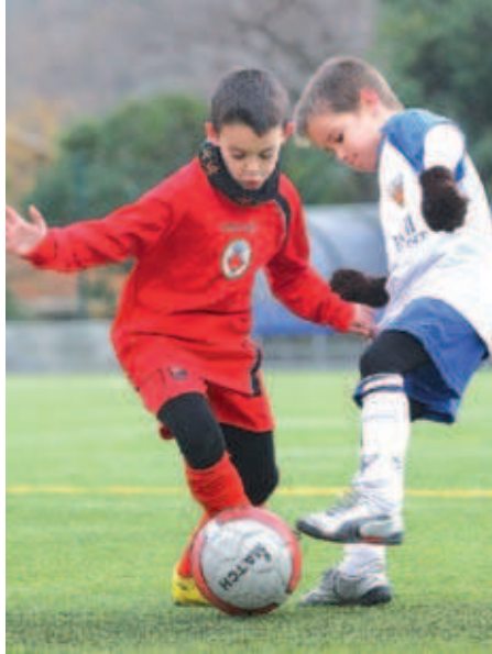
L'EF tindrà enguany cinc equips alevins perquè han passat a ser de futbol 7

L'EF compta amb 8 entrenadors nous. Els infants interessats a jugar a l'Escola es poden adreçar de dilluns a divendres, de 18 a 21h, a l'estadi de la Ferreria o bé al camp de futbol de Can Sant Joan. La presentació de tots els equips de l'entitat es farà, com ja és tradicional, el 12 d'octubre, tot i que enguany la ubicació serà el camp municipal de futbol de Can Sant Joan.