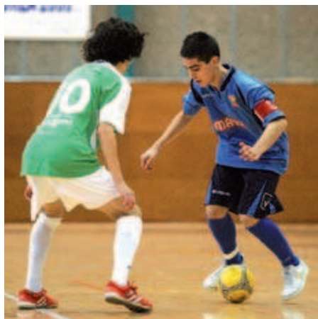
L'FS Mausa Montcada té pràcticament tots els equips a la Divisió d'Honor

Bon planter. L'entrenador també ha destacat que hi ha molt bona fornada de jugadors al club, en especial a les categories juvenils, infantil i benjamí, "que segur que lluiten per es-