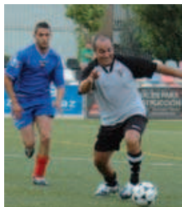
El Santa Maria jugarà enguany a Tercera