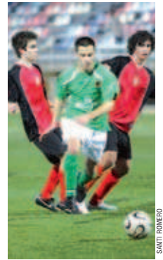
El CD Montcada jugarà al Grup Setè

Lliga difícil. El conjunt local, que ha quedat enquadrat al Grup Setè, s'ha marcat com a objectiu continuar a la categoria, tot i que el seu tècnic ha afegit que "no descartem res, anirem pas a pas però aspirem a tot" . Meca reconeix que aquesta campanya serà més difícil que l'anterior perquè els rivals