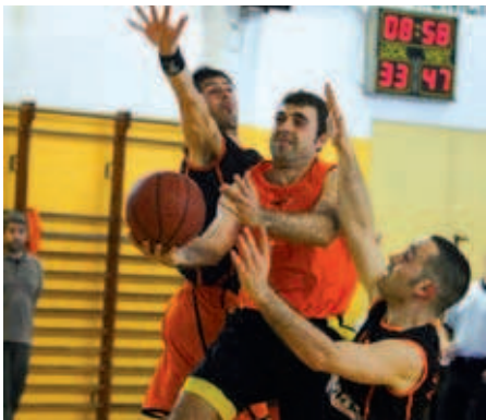
El B. Montseny-Can Sant Joan jugarà novament al Campionat Territorial