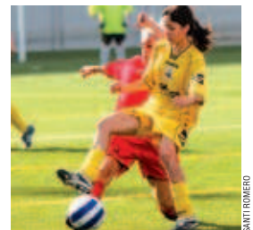
El femení de l'EF s'ha reforçat molt