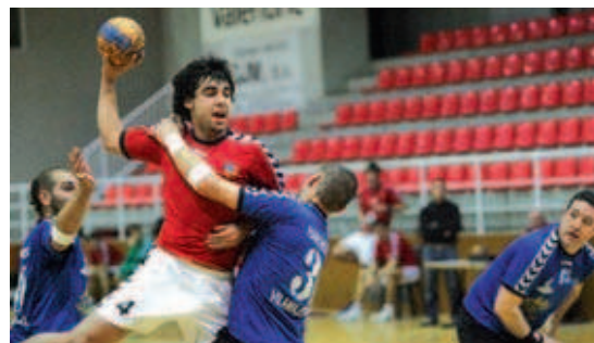
La Salle ha reforçat la plantilla per intentar quedar entre els primers classificats de la Lliga