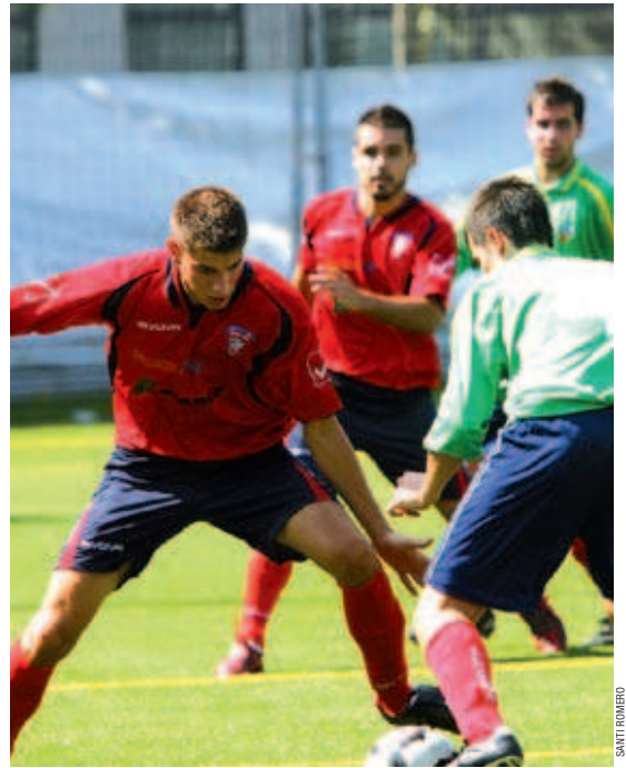
El Sant Joan va debutar a casa contra la Torreta i no va poder passar de l'empat a zero gols