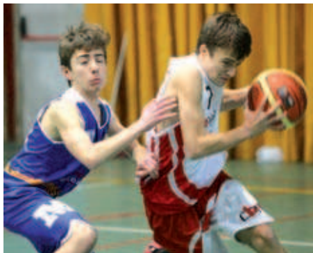
El Valentine presenta força novetats amb l'arribada de la nova junta directiva

edició, la inscripció arriba ja a prop dels 30 infants, que entrenen els dimarts i dijous de 17.15 a 18.45h. Les persones interessades es poden adreçar en aquest horari per la pista coberta o bé per les oficines del club. "Volem fer una escola amb valors més globalistes, que els nois s'ho passin bé gaudint amb el bàsquet" , ha indicat el nou