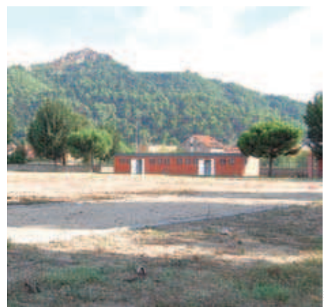
La nova instal·lació de La Ferreria disposa també de vestidors amb dutxes