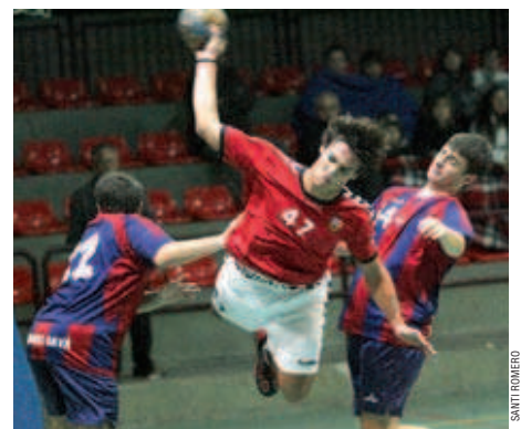
La Salle vol potenciar el planter amb la difusió de l'handbol a més escoles