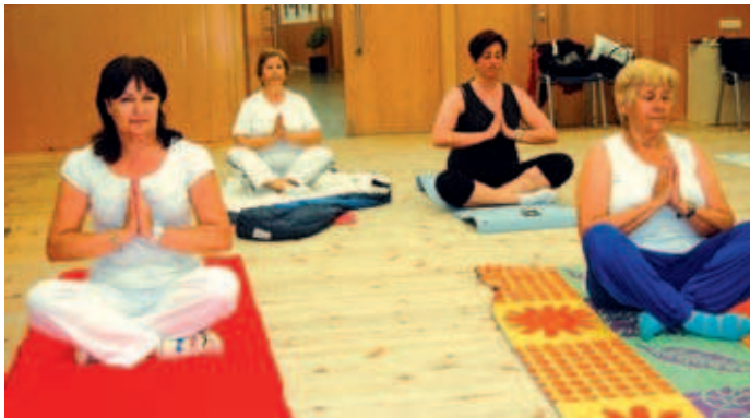
El ioga és una de les activitats que oferta l'IME a diferents equipaments municipals com ara la Casa de la Vila

L'Institut Municipal d'Esports i Lleure (IME) ha obert les inscripcions per a les activitats esportives programades a la Zona Esportiva Centre, al pavelló Miquel Poblet, al Kursaal i a la Casa de la Vila. Al gimnàs municipal del carrer Bonavista hi haurà classes d'aerobic de manteniment, tonificació, steps, tai-txi per a adults, a més d'aerobic i tai-txi per a infants. Per als més grans, l'IME també oferta una gran quantitat de cursos de diferents estils de balls com els latins, els de sala, roda cubana, en línia i danses orientals. Pel que fa a la resta d'equipaments, Esports ha treballat conjuntament amb la Regidoria de Cultura per oferir a la ciutadania pilates, ioga i tai-txi al pavelló Miquel Poblet, tai-txi, ioga i dan-