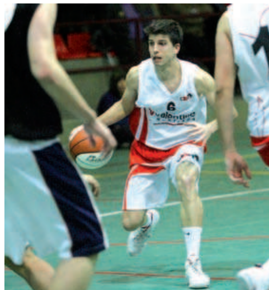
El Valentine s'estrena a la Copa Catalunya el dia 18 a la pista del Santa Coloma de Gramanet