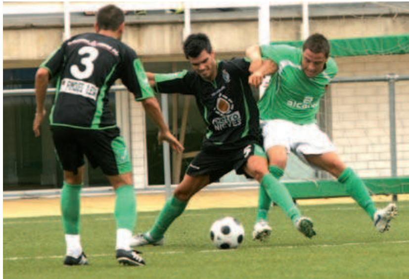
El CD Montcada no va poder imposar-se a l'Olesa, un dels favorits per pujar, en el primer matx de lliga de la Primera Catalana

Un punt. El CD Montcada ha debutat a la lliga amb una derrota a casa contra l'Olesa, un dels favorits per pujar, per 1-4 i amb un empat a zero en el seu desplaçament a Igualada. Els verds han ofert en ambdós enfrontaments una bona imatge, tot i que els ha faltat punteria de cara a gol.